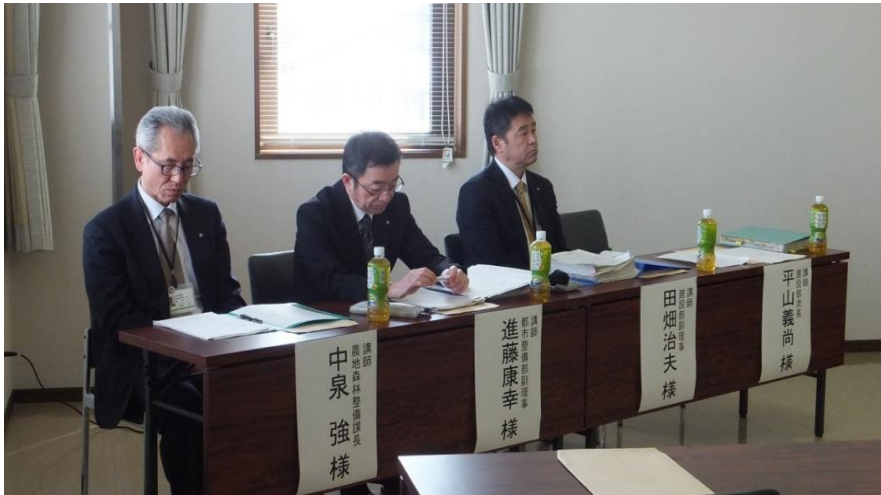
土木・建築の 講演者の皆様