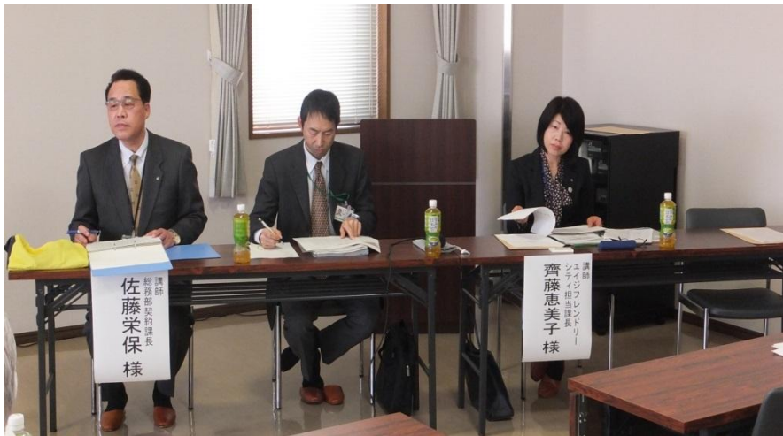
契約関連講師の皆様