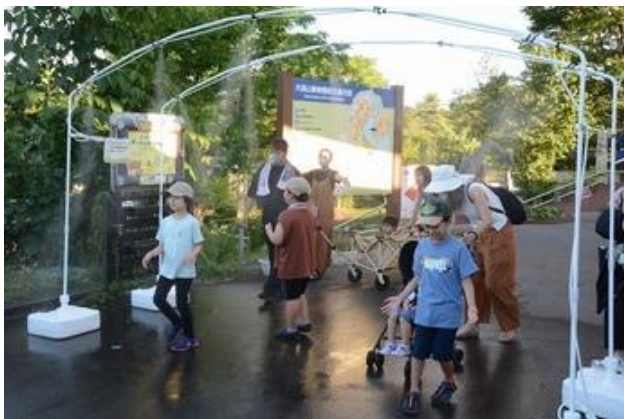
(ミストアーチダブル)

○寄贈品を使っていたいでいる様子です。(秋田市大森山動物園ホームページより引用)