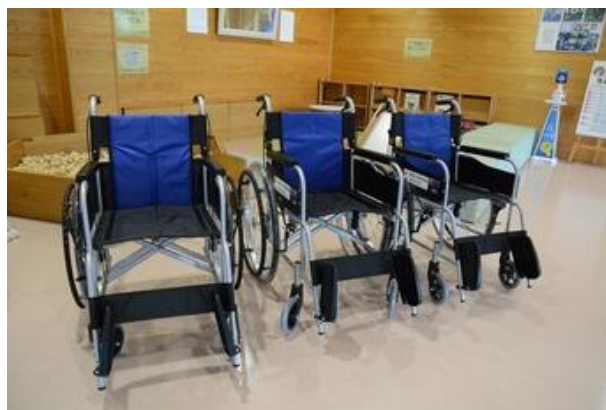
(折り畳み式車いす)