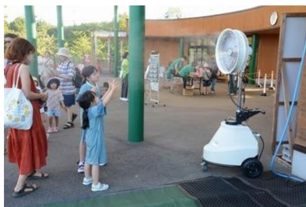
(スーパーエコミスト)